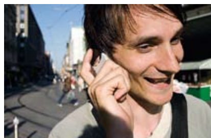
Финны – нация сотовых телефонов и компьютеров. 97 процентов финнов владеют сотовыми телефонами. Ведущая компания на мировом рынке изготовления сотовых телефонов – «Нокия» – является финской компанией.

Государство поддерживает научную и инновационную деятельность. Во многих отраслях Финляндия занимает лидирующее место как в области научных исследований, так и в производстве продукции и