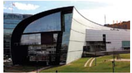
Финны ценят культуру и проявляют себя во многих ее областях. Их достижения в области музыки, литературы, изобразительного искусства, дизайна и архитектуры известны далеко за пределами Финляндии.

проживает лишь 5,3 миллиона человек, то есть в среднем 17 человек на квадратный километр. В столице Финляндии – городе Хельсинки – и окрестных коммунах проживает миллион человек. 71 % населения страны – горожане.