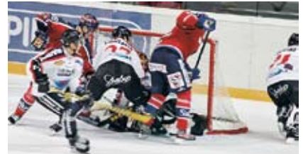
Финны - спортивный народ. Наиболее популярными видами спорта являются, в частности, гольф, катание на лыжах, горнолыжный спорт, легкая атлетика, спортивная ходьба с палками и хоккей.

Финляндия представляет собой обширную редконаселенную территорию на севере Европы. В этой стране, являющейся одной из крупнейших в Европе по площади,